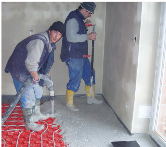
Lití potěru na systémovou desku

Optimální konzistence hmoty se pohybuje kolem 240 mm rozlivu (+-10mm), maximálně 260 mm (měřeno na suché rozlivové desce). pokud je tloušťka vrstvy vyšší než 50 mm, doporučuje se konzistence do 230 mm. Směs se nanáší na nepropustný povrch kývavým pohybem hadice, aby se dosáhlo rovnoměrné struktury zrna. Směs nesmí vniknout pod separační vrstvu!