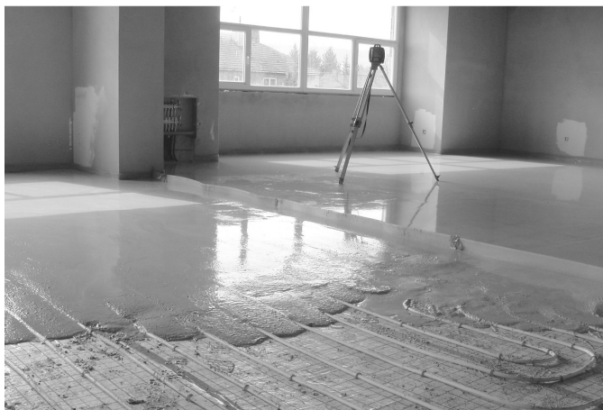
Lité podlahy prodejny (s podlahovým topením)

Vzhledem ke způsobu dopravy směsí domíchávačem je zpomalovacími přísadami zajištěna prodloužená zpracovatelnost na min. 4 hodiny.